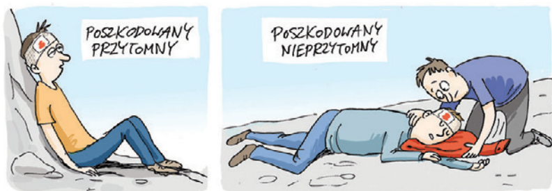
Pozycja ciała dla poszkodowanego przytomnego i nieprzytomnego po urazie głowy.