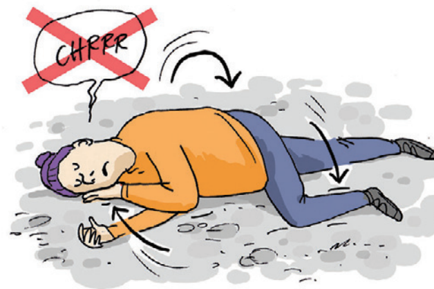
Po ułożeniu osoby ratowanej w pozycji bezpiecznej upewnij się, że jej drogi oddechowe są drożne.